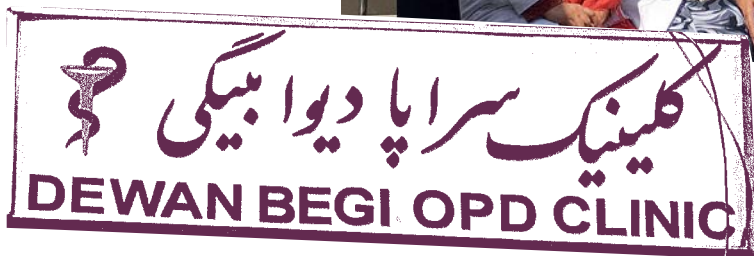
Starke Truppe: Die Mitarbeiter der Kabuler Klinik setzen gezielt auch auf Know-how ausländischer Kollegen.

Sicherheit und Entwicklung sorgen sollten. Heute wird lediglich der Stadtkern von der Regierung kontrolliert, die restlichen Regionen stehen unter dem Einfluss der Taliban. Die Lage ist sehr instabil.